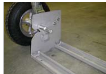
Option - Béquille de stabilisation, utile pour l'utilisation sur barge.