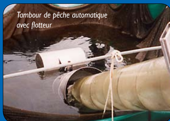
Tambour de pêche automatique avec flotteur