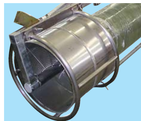
Tambour de pêche des série F77

Consultez-nous pour les élévateurs de pêche qualité eau de mer.