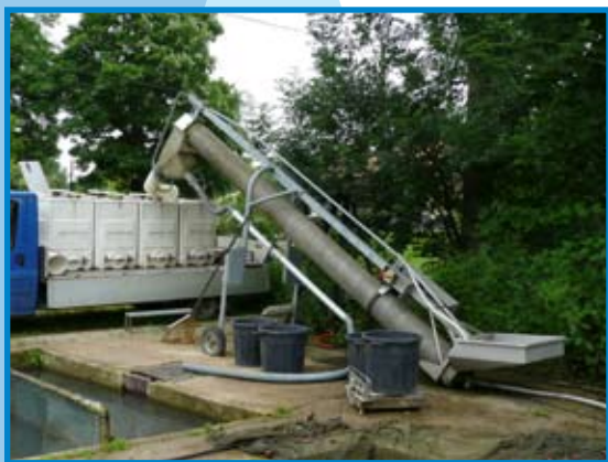
Élévateur de chargement F85.