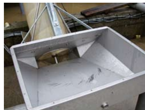
Trémie de chargement des série F85

Consultez-nous pour les élévateurs de chargement qualité eau de mer.