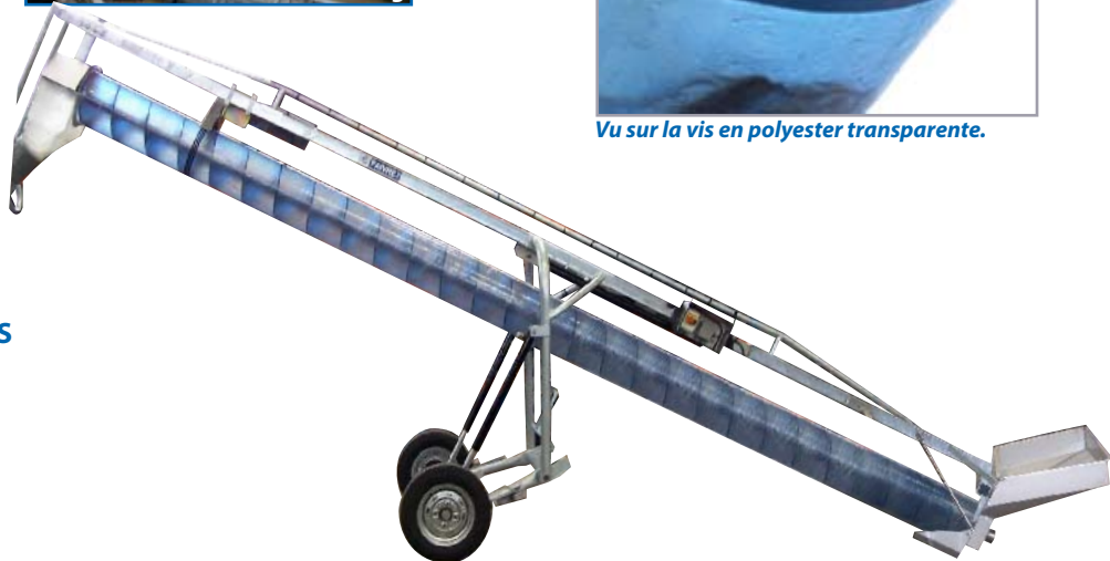
Série 85 vis Ø450mm long. 5m - option EPHP.