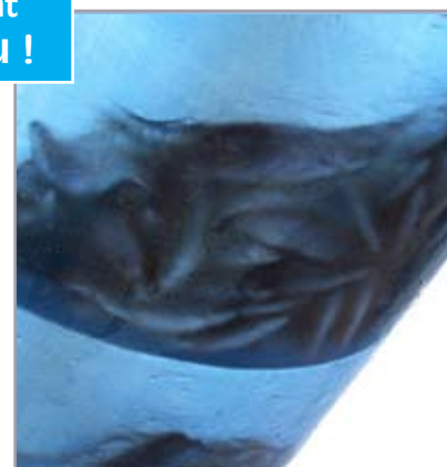
Vu sur la vis en polyester transparente.