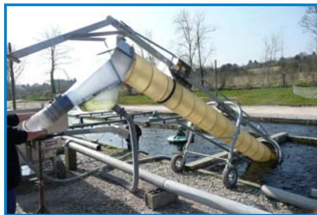
Élévateur de pêche série 77 Vis Ø 450mm - 5 m de long Option Edhp et séparateur d'eau.