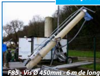
F85 - Vis Ø 450mm - 6 m de long