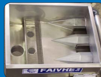
Vista interior de la tolva de entrada con toma opcional para una bomba de peces y un separador de agua.