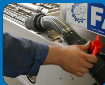
Alimentación de agua totalmente regulable mediante válvula