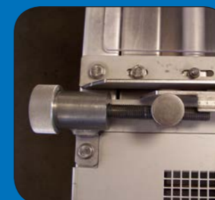
Nonio de ajuste