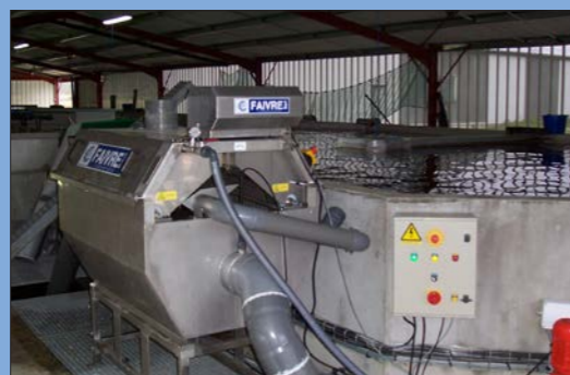
Modèle 4-80 avec maille de 60µ dans un circuit fermé d'esturgeon