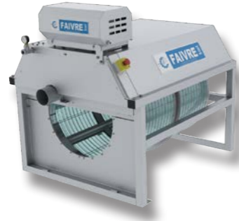
Filtre sur bâti