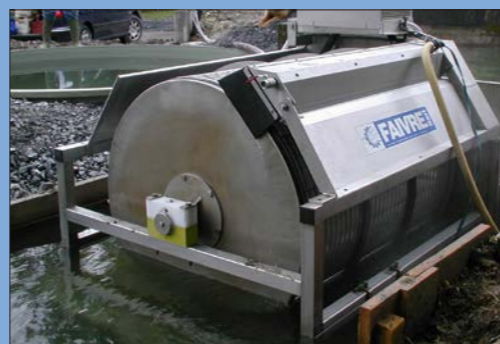
Modèle 9-120 sur bâti (sortie de pisciculture)