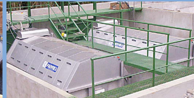
2 filtres 28-160 sur bâti en sortie de pisciculture