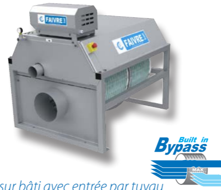
filtre sur bâti avec entrée par tuyau

Les filtres avec réservoir et avec entrée par tuyau sont équipés d'une surverse interne de sécurité.