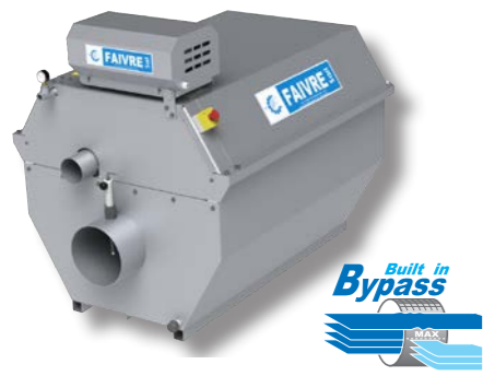
Filtre sur cuve