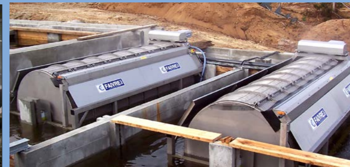
2 filtres 32-160 sur bâti dans une ferme d'esturgeon