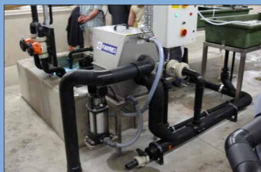
Modèle 2-40 avec maille de 36 microns dans un petit circuit fermé.