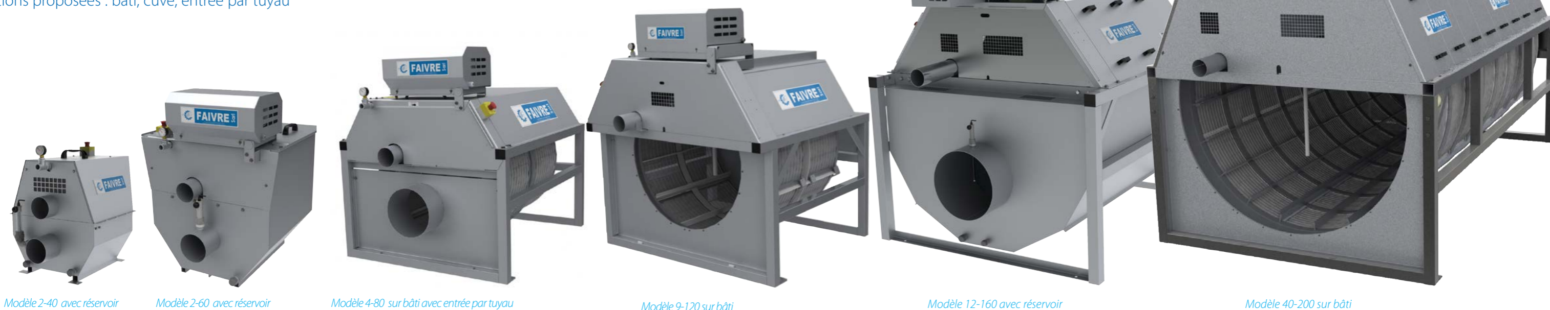
Modèle 2-40 avec réservoir

Les filtres série 200 sont spécialement conçu pour la filtration des effluents sortants des grandes piscicultures, ils conviennent aussi parfaitement pour les circuits fermés de grande taille.