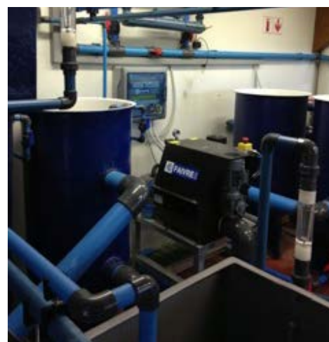
Filtre série 1-40 sur cuve PEHD dans une installation