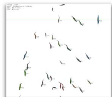
Grabación de vídeo del conteo

Fotos y datos técnicos no contractuales, la sociedad Faivre Sasu se reserva el derecho a modificar las características de sus máquinas cuando así lo desee.